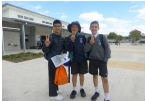
オーストラリアの中学生との相互交流(2016～)