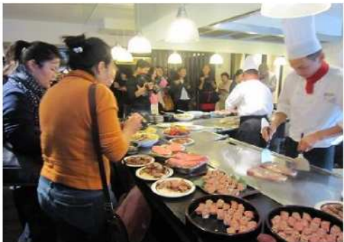
モンゴルで都城産宮崎牛をPR(2015～)

モンゴルのホストタウンに2016年に決定し、レスリングを通じた交流を実施しています。