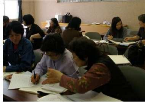
日本語学習支援の機会拡充 (2012～)

「防災に関する情報がほしい」「外国人同士が交流する場がほしい」との要望を受け、防災や救急・交通安全に関する講習会を実施しています。