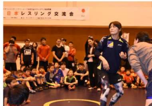
2020東京オリンピック・パラリンピック競技大会ホストタウン推進事業(2017～)

モンゴルのホストタウンに2016年に決定し、レスリングを通じた交流を実施しています。