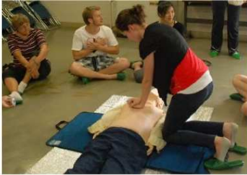
生活安全に関する情報提供 (2013～)

外国人市民も共生できる社会づくりのために、外国人市民が直面する障壁を取り除く施策への取組みを強化しました。