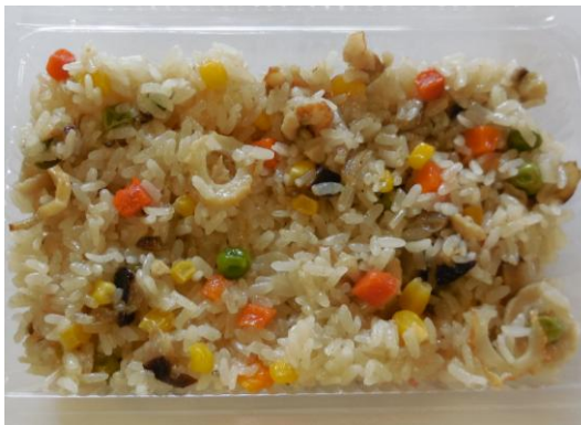
出店者：よいやんせ財部 料理名：山菜おこわ