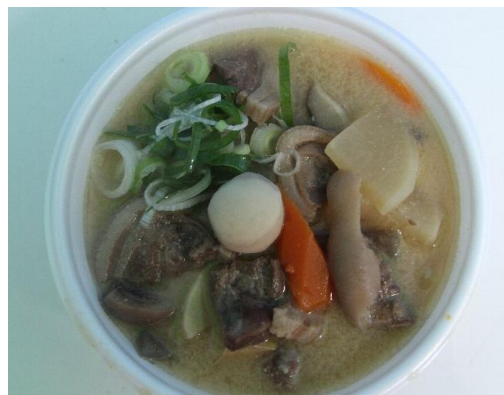
出店者：手作り屋 料理名：猪汁（しし汁）