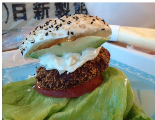
出店者：株式会社岡留蒲鉾本舗 料理名：お魚コロッケバーガー