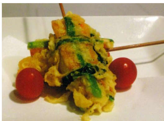
出店者：喰い sininer ken. (クイジニエケン) 料理名：洋風変わりがね