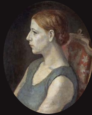
「伊太利婦人像」1931年 宮崎県立美術館