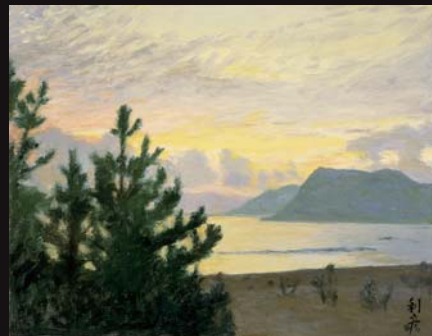
「日南風景 折生迫乃黎明」1981年