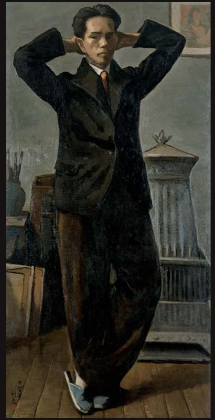
「足を組んで立つ」1929年