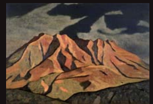
「桜島」1965年頃 鹿児島市立美術館