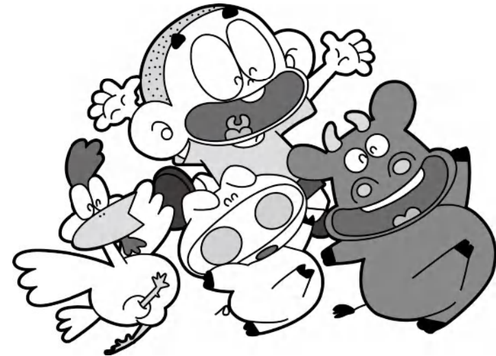
みやこんじょ大使 ぼんちくん