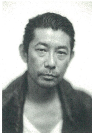
永瀬 正敏 氏 (俳優・写真家:都城市出身)