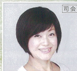
関 知子氏 [MRTアナウンサー]