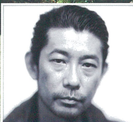
永瀬 正敏氏 [俳優・写真家]