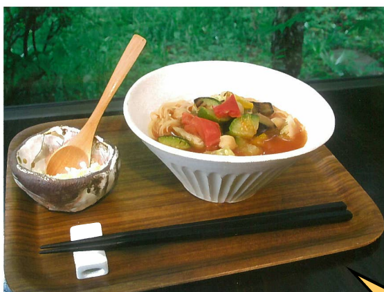
出店者：フードギャラリー空そら 料理名：みや根じょベジごろスープ麺