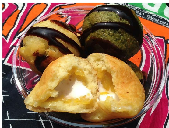
出店者：牧 真理子 料理名：緑茶とサツマイモのドーナツ