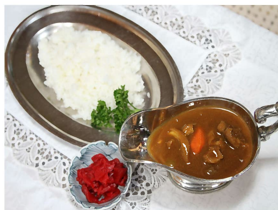
出店者：手作り屋 料理名：しし肉カレー