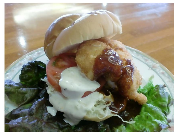
出店者：国民宿舎ボルベリアダグリ 料理名：はもカツバーガー