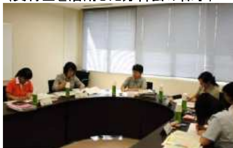
(H26 少子化シンポジウムでの分科会)