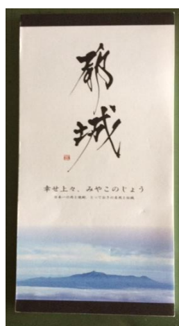
一筆箋 (30枚綴) 82mm × 186mm