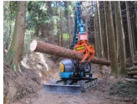
ウインチ付グラップル