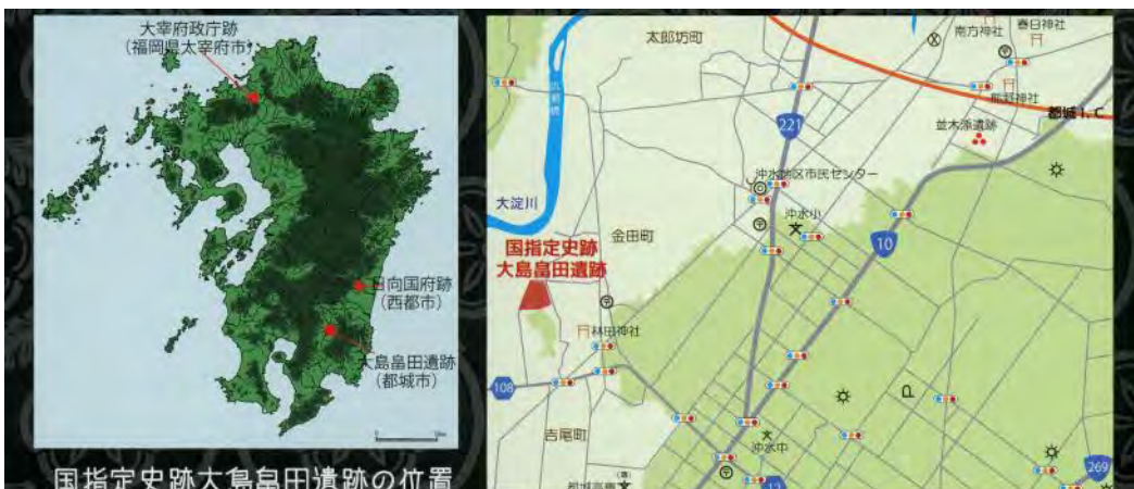
国指定史跡大島畠田遺跡の位置