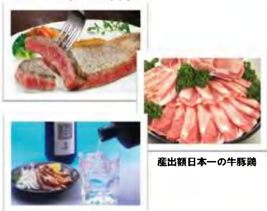
産出額日本一の牛豚鶏