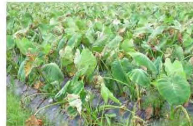
サトイモ疫病が蔓延した畑