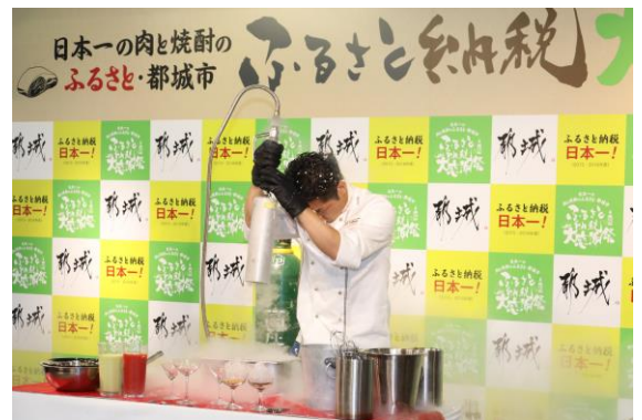
ジェラートイリュージョン