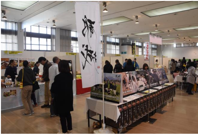
昨年度のイベント模様

当市のふるさと納税推進事業に対する市民の理解を深めてもらうため、ふるさと納税市民向けイベント「日本一の肉と焼酎まつり ～都城市のふるさと納税を知ろう～」を開催します。