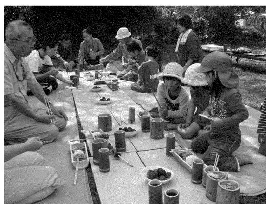
写真 「ボンパク」の様子