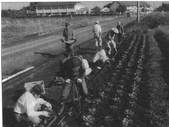
写真 県道沿いの花壇への植え付け