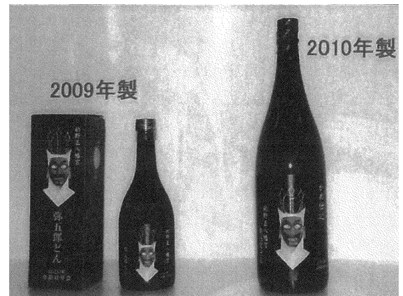
写真 地域で栽培したサツマイモを原料に作られた オリジナル焼酎「的野正八幡宮弥五郎どん」