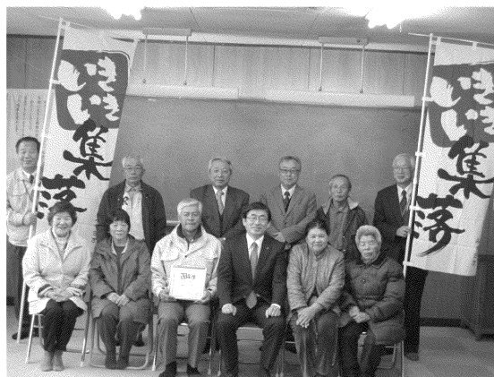
写真 「いきいき集落」認定式（四家地区）