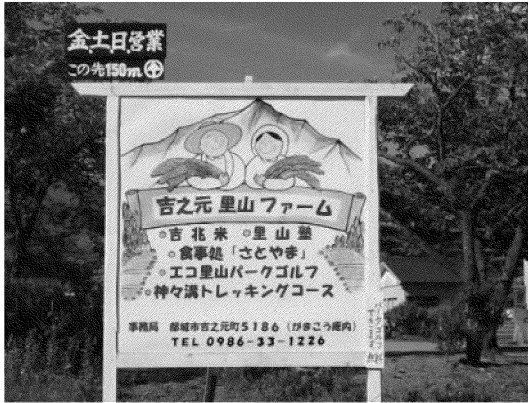
写真 吉之元里山ファームの看板