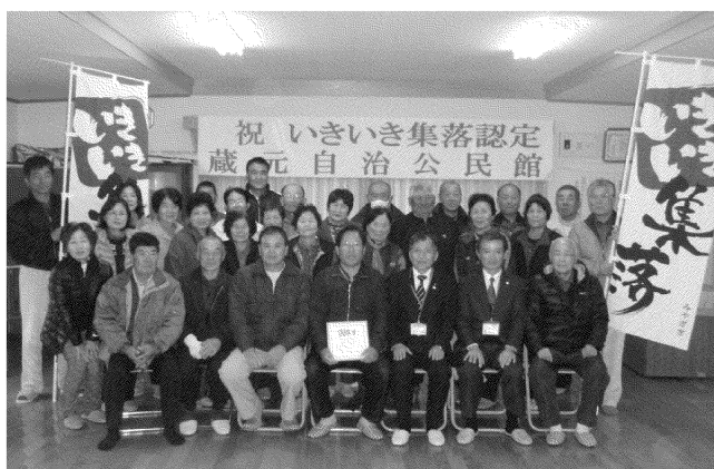
写真 「いきいき集落」認定式（蔵元自治公民館）