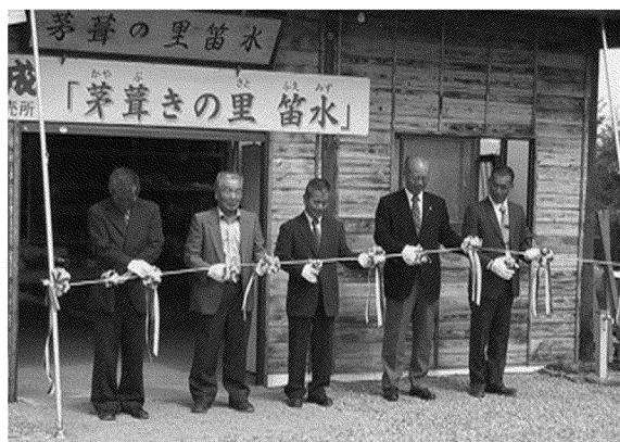
写真 「茅葺きの里」落成式