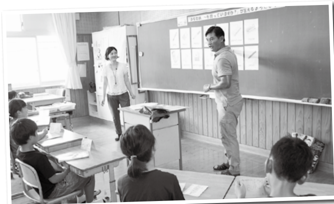
安久小での外国語活動の様子