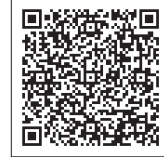
厚生労働省 ホームページ

「正しい手洗い」や「咳エチケット」を心掛け、感染予防を徹底しましょう。次のいずれかの症状がある人は、「帰国者・接触者相談センター」に相談ください。