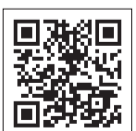
みやざき医療ナビ

※自動音声案内も行っています。医師会 ☎23-5555、歯科医師会 ☎25-4100を利用ください（通話料は利用者負担）